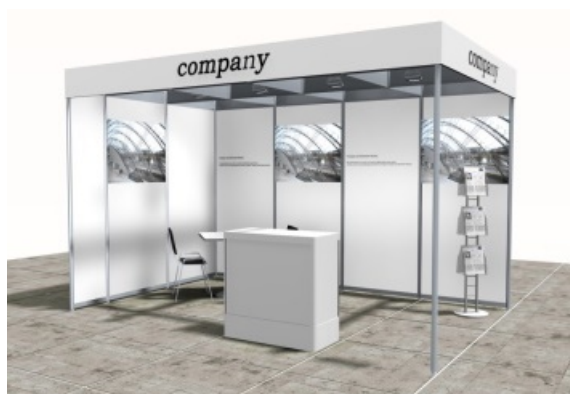
Beispiel Ansicht / example of view 10 m 2