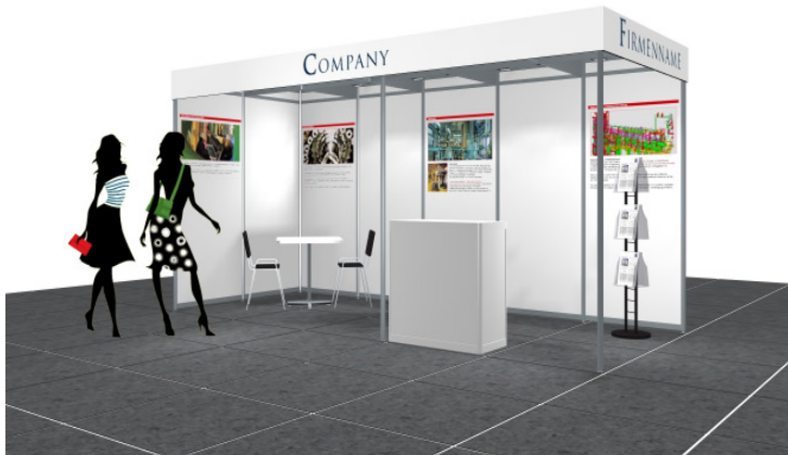
Beispiel Ansicht / example of view